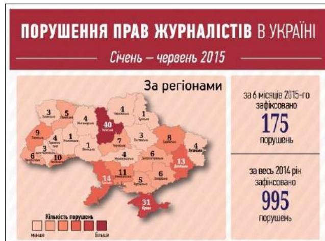
Рис. 2.1. Інфографіка на сайті інформаційного агентства УНІАН (матеріал за 03.07.2015 р.).

Скріншот слід подати в суцільній рамці товщиною 0,25 пт. (рамку встановлюють у вкладках «Формат малюнка» → «Кольори та лінії»).