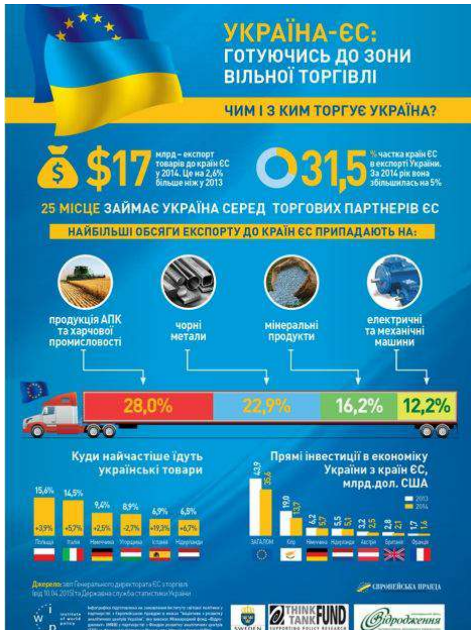
Рис. А.2. Інфографіка «Україна-ЄС: готуючись до зони вільної торгівлі», опублікована на сайті «Institute of World Policy» (iwr.org.ua) 28.06.2015 р.