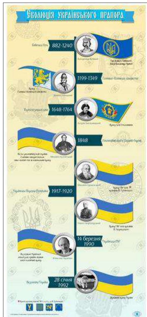
Рис. А.1. Інфографіка «Еволюція українського прапора», опублікована на сайті інформаційного агентства «УКРІНФОРМ» 14.08.2015 р.